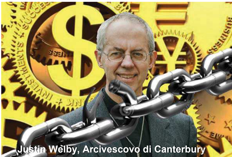
Justin Welby, Arcivescovo di Canterbury

Lo ha affermato Justin Welby , Arcivescovo di Canterbury: il modello economico britannico è broken (rotto) in una recente intervista: ( https://www.sun-fm.com/news/local/2372966/justin-welby-claims-britains-economic-model-is-broken/ )